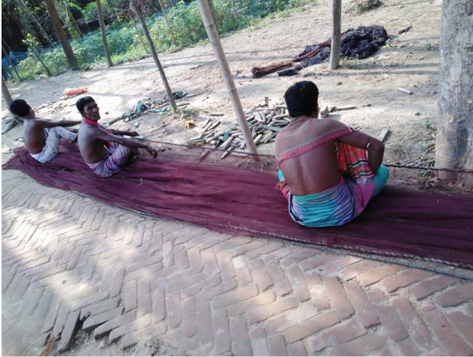
ব্রাহ্মণবাড়িয়ার নাসিরনগরের হরিণবেড় থামে কর্মরত মালো কৈবর্ত