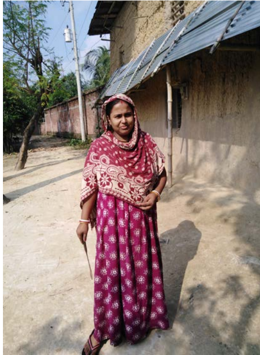
কৈবর্তখণ্ড গ্রামের একমাত্র হিন্দু পরিবারের (কামার) একজন সদস্য