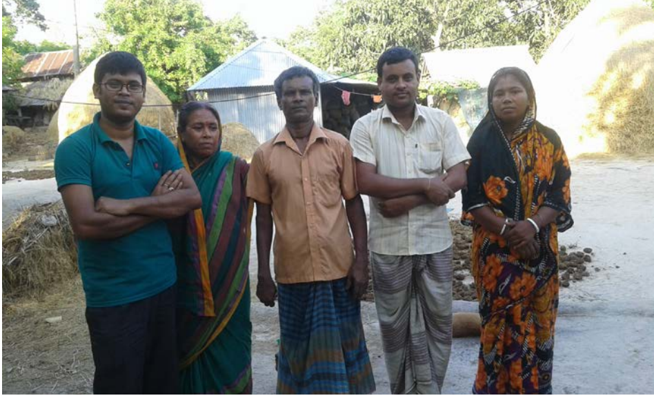
নওগাঁ জেলার রানীনগর উপজেলার দেউলা গ্রামে দলীয় আলোচনায় অংশগ্রহণকারী মাহিম্য ব্যক্তিদের একাংশ