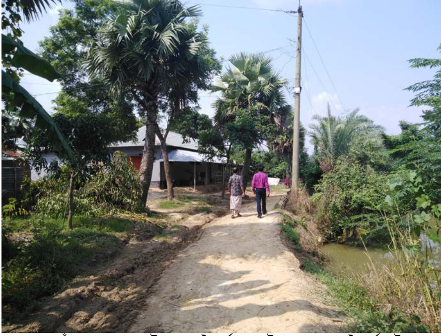
নওগাঁ জেলার সাপাহার উপজেলার কৈবর্তগ্রাম, এই গ্রামেও কোনো কৈবর্ত নেই