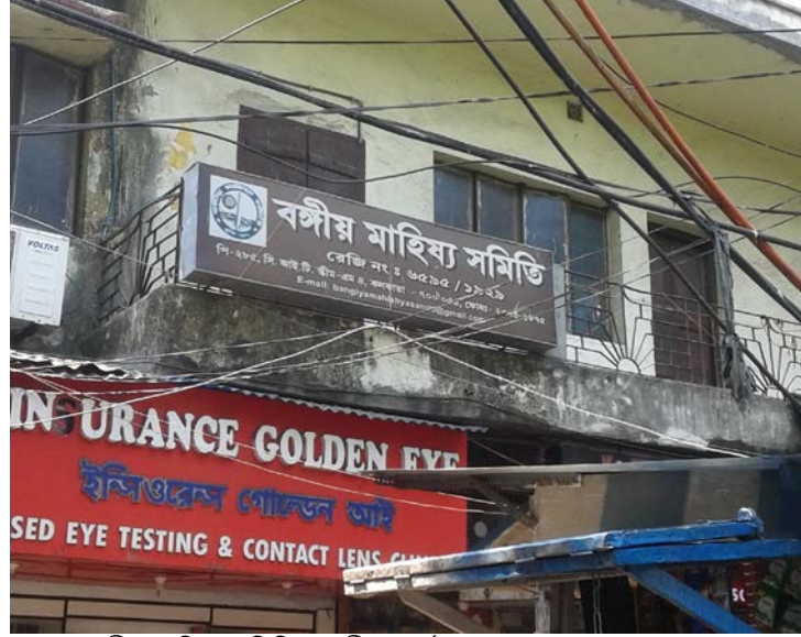
বঙ্গীয় মাছিয় সন্মিত্তি কেন্দ্ৰীয় কাৰ্যালয়, ফুলবাগান, কলকাতা।