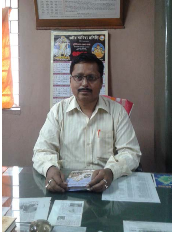
সম্পাদক, বঙ্গীয় মাছিয় সন্মিত্তি