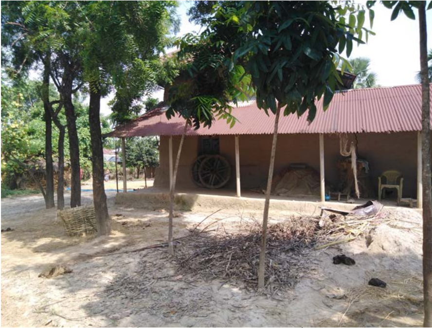
নওগাঁ জেলার সাপাহার উপজেলার কৈবর্তগ্রাম