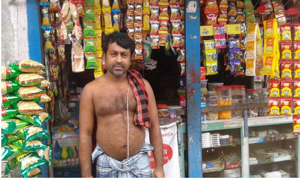
চট্টগ্রামের উত্তর পতেঙ্গা জেলেপল্লীর মুদি দোকানদার ব্রাহ্মণ পুরোহিত