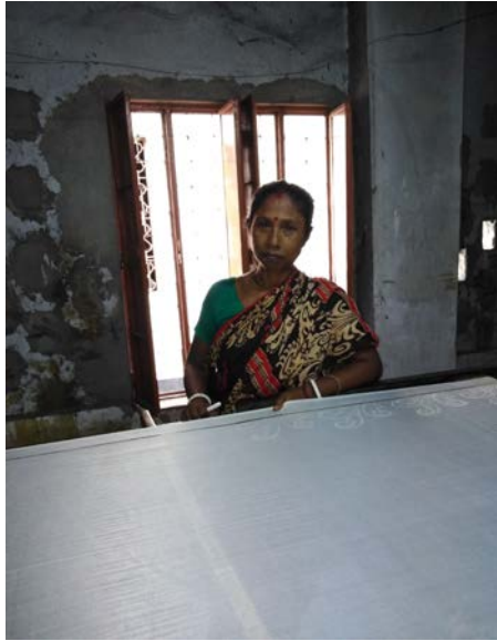
রাজশাহী শহরের সপুরা কারখানায় রেশম শাড়িতে নকশা করছেন এক মাহিম্য নারী