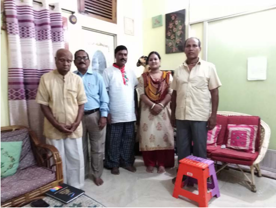
সিলেট শহরের হালদারপাড়ায় জেলে কৈবর্তদের সঙ্গে দলীয় আলোচনা