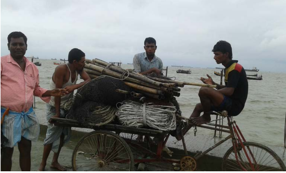
চট্টগ্রামের উত্তর পতেঙ্গা জেলেপাড়া, জেলেদের বঙ্গোপসাগরে মাছ ধরার প্রস্তুতি