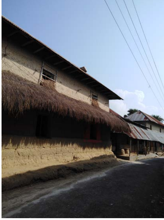
নওগাঁ জেলার কৈবর্তখণ্ড গ্রাম, এখন সেখানে কোনো কৈবর্ত থাকে না