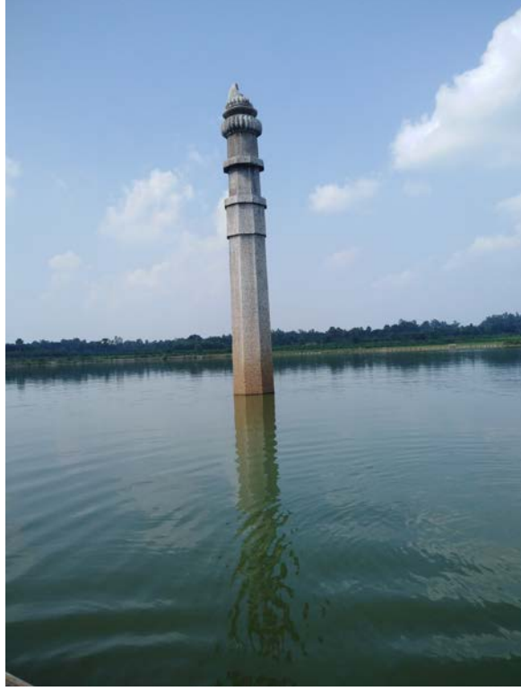
দিব্বকের স্মৃতিবাহী স্তম্ভ